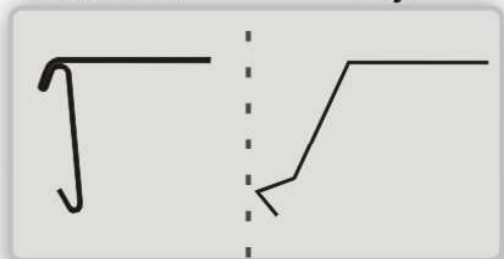
Porta precio Fijo